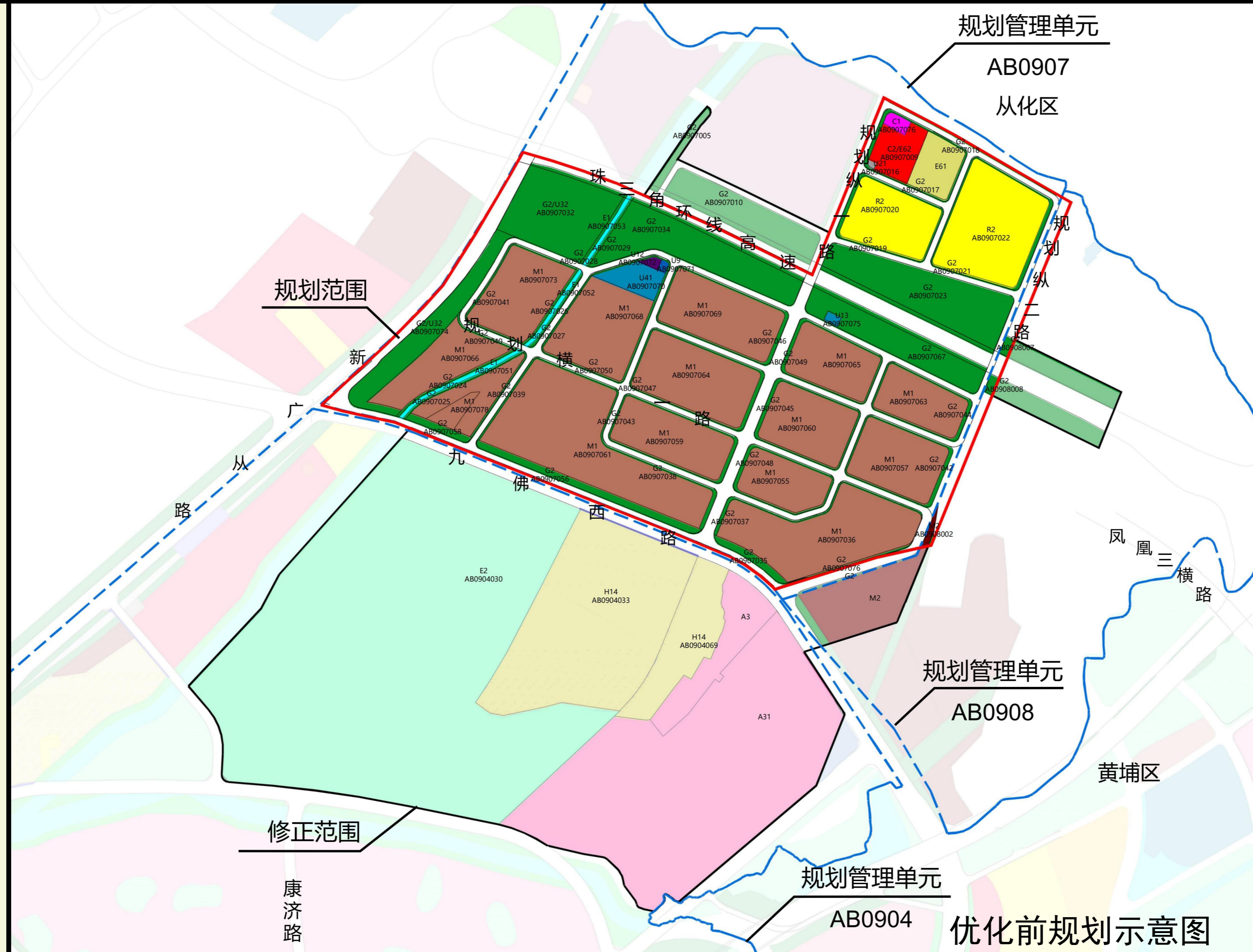
优化前规划示意图

查询网址： https://ghzyj.gz.gov.cn/ywpd/cxgh/cxghtzgg/