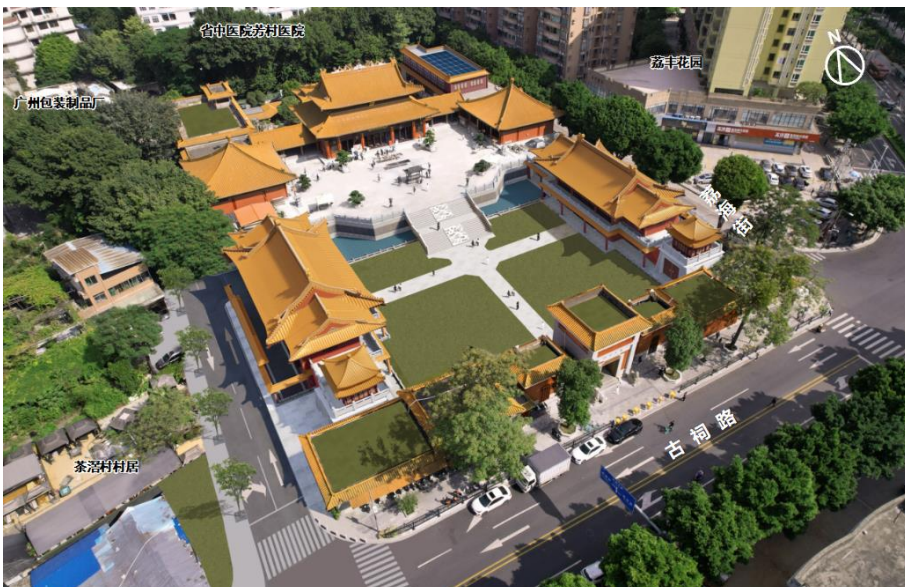
黄大仙祠改建提升工程效果图

黄大仙祠作为广州重要的宗教场所与旅游景点，常年客流密集，尤其在节庆与旅游旺季人流量远超承载能力，导致空间拥挤，同时功能配套不足及车位匮乏等问题也制约了其发展。为保障后续改建提升工程顺利推进，缓解客流压力并提升游览体验，亟需对该地块的控规指标进行合理优化调整。