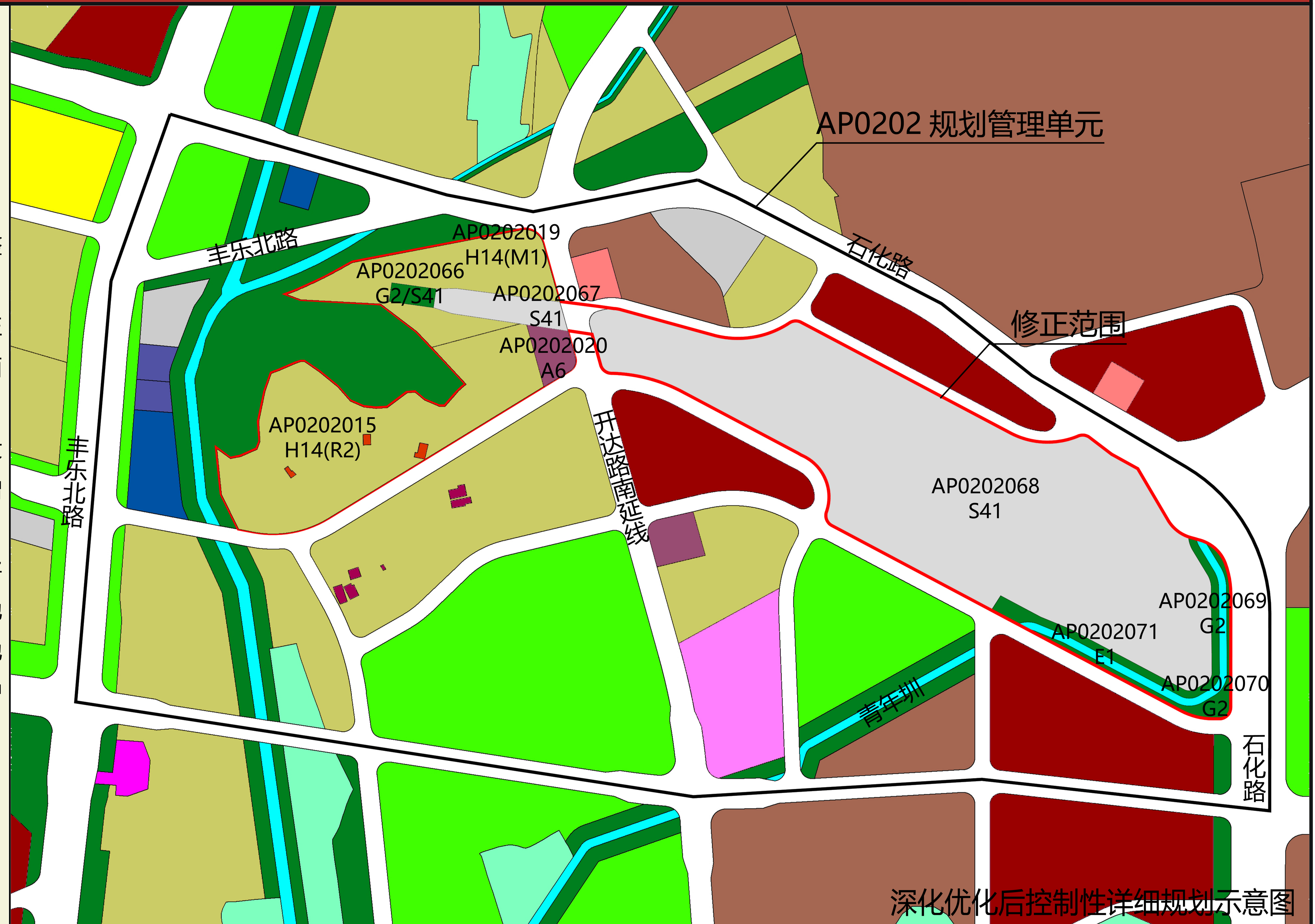
深化优化后控制性详细规划示意图