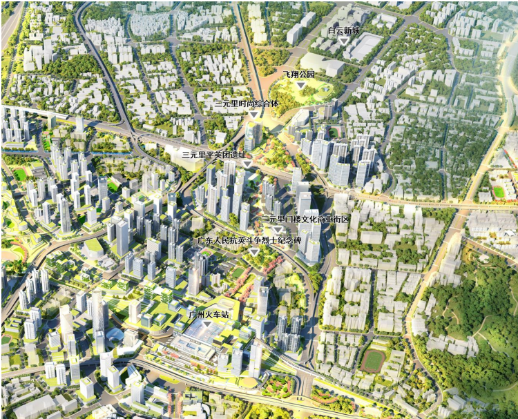
三元里村城市设计示意图