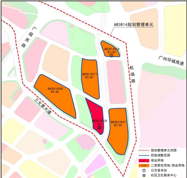
调整后规划示意图