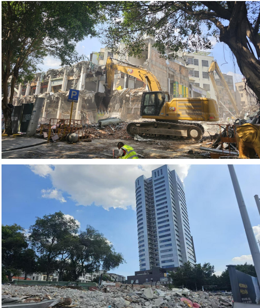
内村地块拆迁现场照片