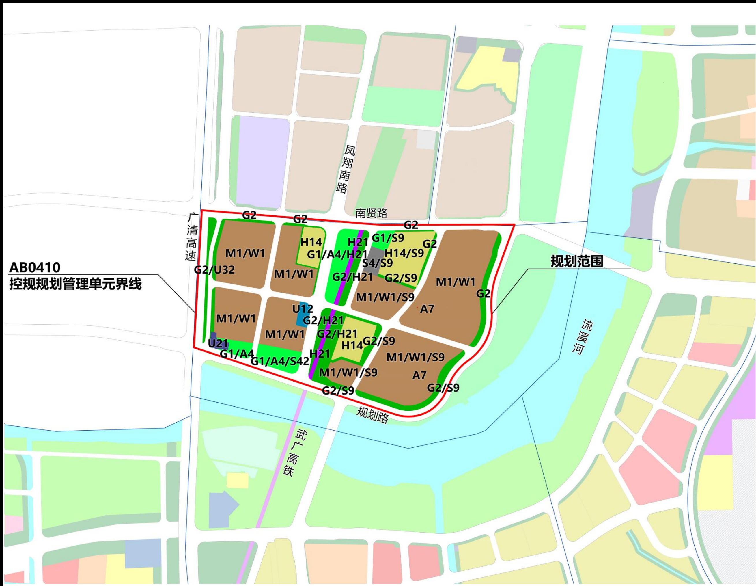
优化后规划示意图